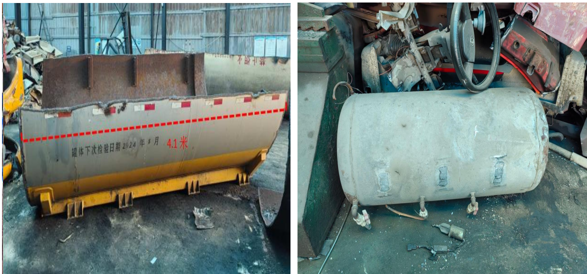
图-5 切割后同比半圆钢板及水箱尺寸信息

切割后的筒体半圆钢板（编号为3号板）长约4.1m、直径约2.5m、壁厚1.1cm，通过计算其重约868kg，放置地面的水箱长2.1m、直径0.5m（见图-5）。