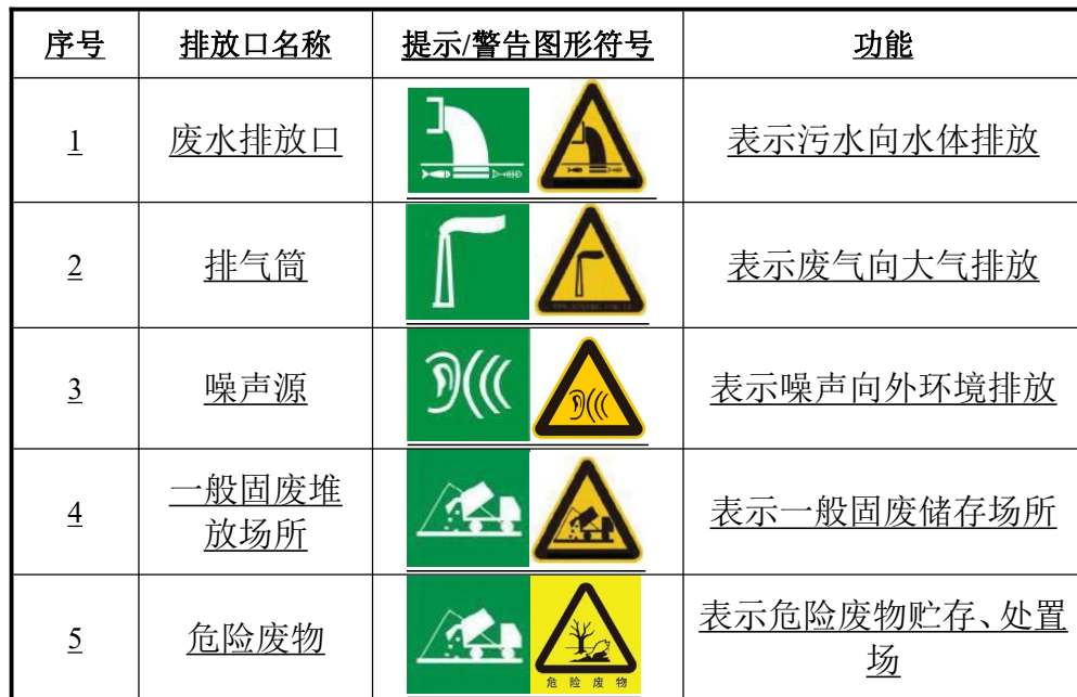
表 5-1 环境保护图形符号一览表

2、标示牌的设置应按《关于印发排放口标志牌技术规格的通知》（环办[2003]95号）中的相关规定实施，统计所有排污口的名称、位置、数量，以及排放的污染物名称、数量等内容上报当地环保部门，以便进行验收和排污口的规范化管理。图形符号分为提示图形和警告图形符号两种，分别按（GB15562.1-1995）、（GB15562.2-1995）及修改单执行。环境保护图形标志的形状及颜色见下表。