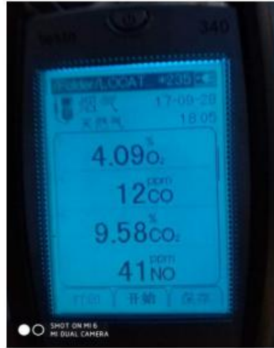
锦西石化重整炉改造后 NOX 现场测量数据