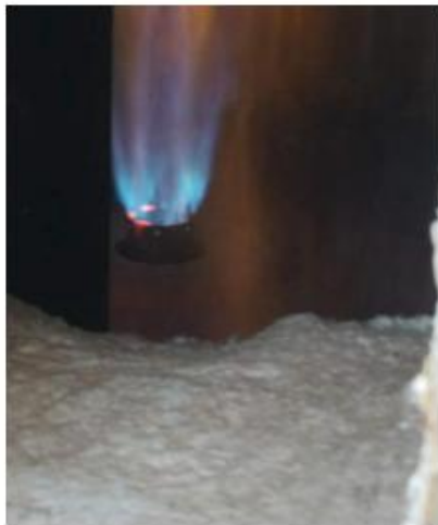
锦州石化加氢炉改造后火焰