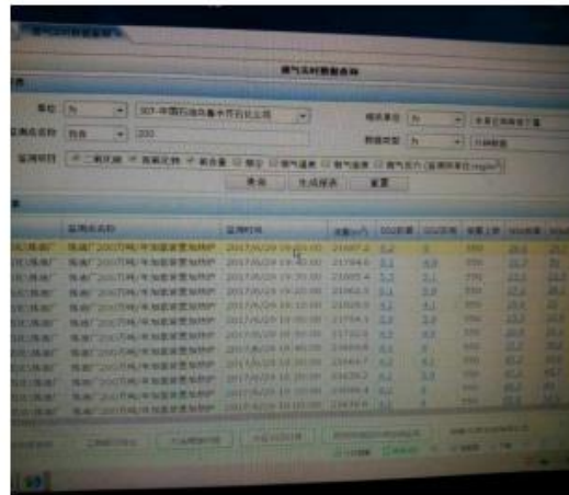
乌石化加氢炉改造后 NO x 在线监测数据