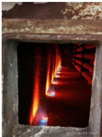
庆阳加氢炉改造后火焰

新型低氮燃烧器火嘴改造是利用原有燃烧器的特点不做大的改动，更换燃气喷枪及配件来达到降低 NO x 的目的。工艺原理：重新计算辅枪燃料喷射比例与角度，减小燃料集中放热。燃料气枪通过分支喷出，燃料喷射在火道砖壁上，使侧壁烧红达到蓄热的目的保证火焰的稳定性。形成的燃料圈外包裹助燃空气并混合燃烧。燃料的分阶段燃烧有效的降低了火焰区域的燃烧温度，抑制了热力学 NO x 的形成。该工艺目前已在 中国石油庆阳分公司常压炉和加氢炉脱硝技术改造项目，中国石油乌鲁木齐分公司减压炉、大芳烃、加氢炉脱硝技术改造项目，中国石油锦州石化分公司加氢炉脱硝技术改造项目及中国石油锦西分公司重整炉脱硝技术改造项目取得成功应用。