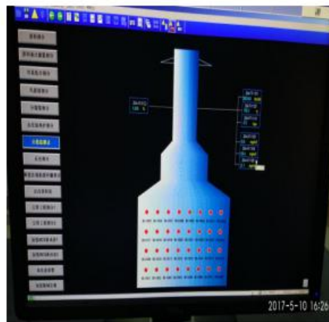
庆阳加氢炉改造后 NO x 在线监测数据