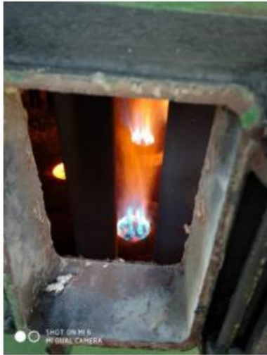
锦西石化重整炉改造后火焰