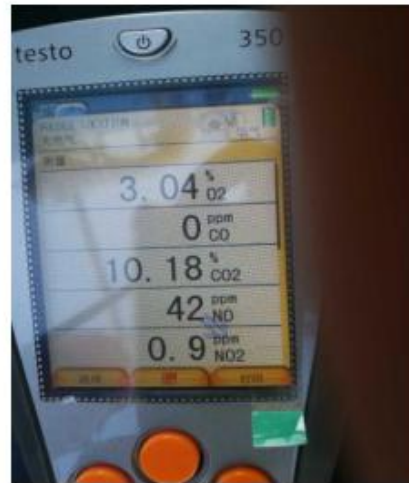
锦州石化加氢炉改造后 NOX 现场测量数据