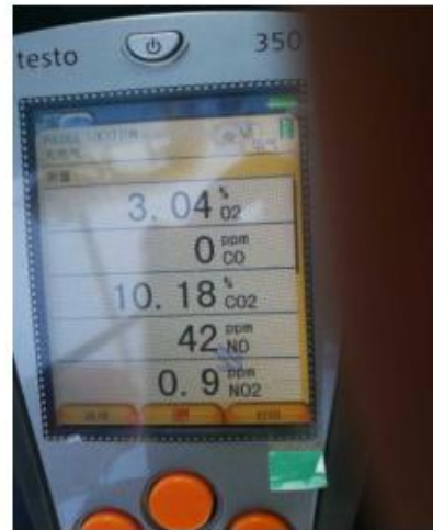
锦州石化加氢炉改造后 NOX 现场测量数据