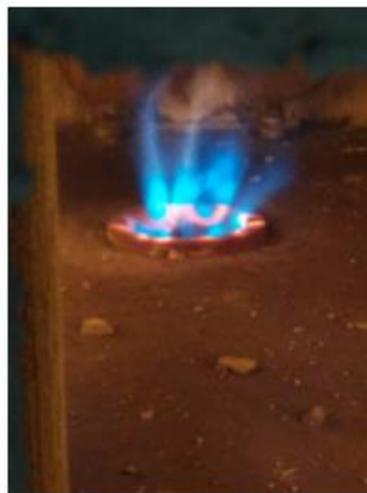
乌石化加氢炉改造后火焰